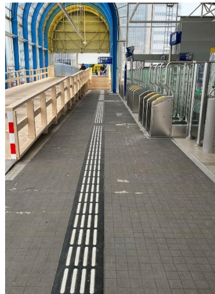
BIGL K-30-3 | ProRail mat